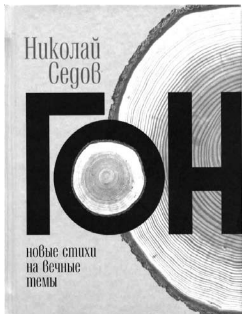
Седов, Николай Гон: новые стихи на вечные темы / Н. Седов. — Краснодар: Книга, 2010. — 208 с.

Новая книга Николая Седова включает в себя произведения, созданные в 2007–2010 годах. Автор остаётся верен своим темам, его лирическому герою, как и самому поэту, назначено судьбой жить на изломе двух тысячелетий, двух веков, двух миров. Об этом стихи.