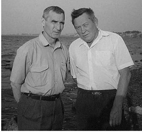
Иноземные путешественники, в разные времена посещавшие Россию, дивились не только бескрайности и красоте ее степей,

лесов, рек и озер, но и врожденной талантливости русского человека, его мужеству, выносливости, сметливости.